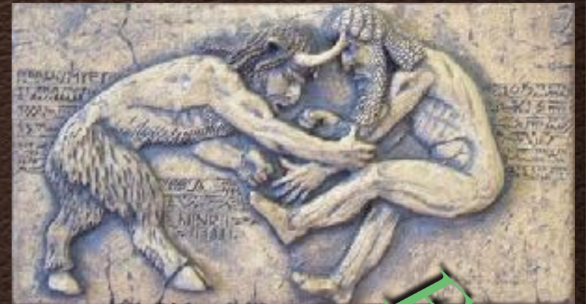
Enkiku vs gilgamesh