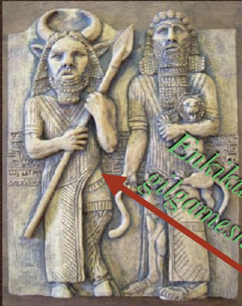
Enkiku et gilgamesh