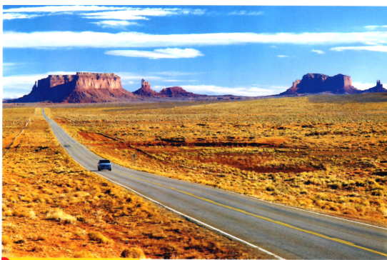
1 La Vallée de la Mort, à l'est de la Californie D'immenses espaces du sud-ouest des États-Unis sont inhabités. Dans cette « Amérique du vide », on ne rencontre que quelques noyaux de peuplement épars et la densité moyenne est inférieure à 1 habitant au km.