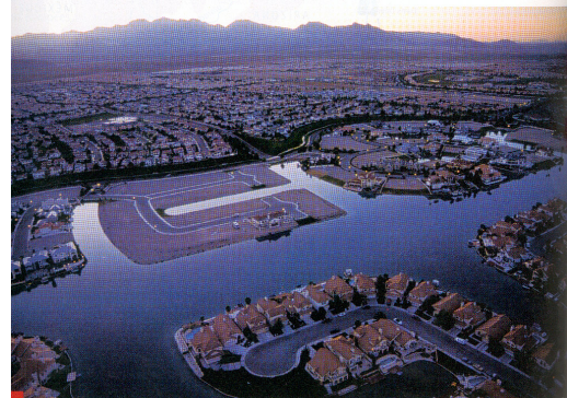
2 Un des beaux quartiers de l'oasis de Las Vegas. L'eau utilisée à Las Vegas vient du lac Mead et de la nappe aquifère.