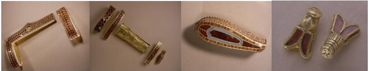
Document 5 : fragment du scramasaxe de Childéric Ier, BNF

Source : Le tombeau de Childéric Ier par l'abbé Cochet, inspecteur des monuments historiques de la Seine-inférieure, Paris 1859.