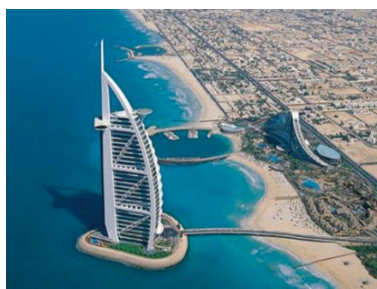
doc2 :Port de Dubaï 2008. Un littoral touristique Depuis 2006, plus grand front de mer du Monde