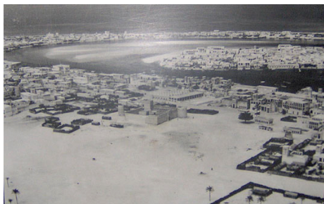
doc1 :Port de Dubaï 1971. Un port pour le pétrole En 1966 sont découvertes les réserves pétrolières.

Exercice 3 : Evolution de Dubaï (1971-2008) / 5 points