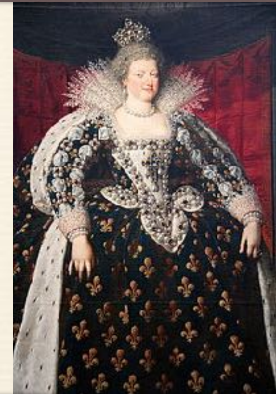
Marie de Médicis