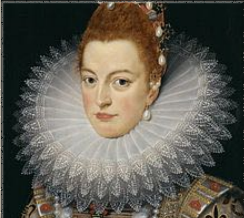
Isabelle Claire Eugénie d'Autriche